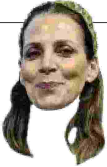
Daria Perrotta Dall'agosto 2024 è il Ragioniere generale dello Stato Classe 1977, è una magistrata contabile, insegna alla Luiss