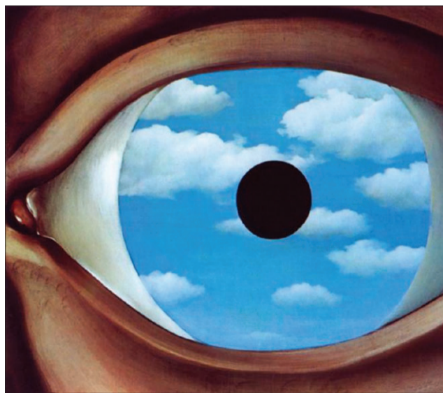
René Magritte, «The False Mirror» (1929, particolare)

con l'esperienza: abbiamo perso le parole e ripetiamo le formule. Il nostro linguaggio si è appiattito, e così la nostra immaginazione. La pubblicazione di questa Lettera è stata una decisione forte che riconosce nella pagina letteraria l'apertura di uno spazio interiore di libertà che permette