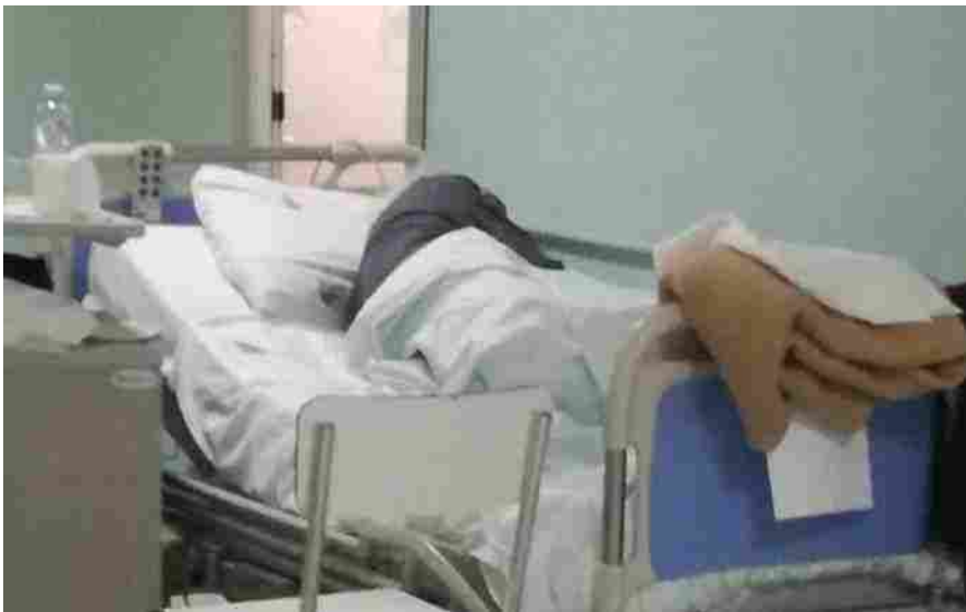
Un anziano ospedalizzato

Migranti per esigenze di salute . CasAmica cerca nuovi volontari per fronteggiare le richieste di accoglienza . La onlus è impegnata da oltre trentacinque anni ad accogliere i malati e i loro familiari costretti a curarsi lontano da casa. "Ora servono energie fresche per fronteggiare la crescente richiesta ", spiegano. Dopo gli anni dell'emergenza sanitaria, infatti, tornano ad aumentare le persone che si spostano dalle proprie città e regioni per motivi sanitari . Per questo CasAmica Onlus cerca nuovi volontari per le sue sei strutture di Milano, Lecco e Roma. Al fine di potenziare i servizi offerti. E aiutare sempre di più chi ha bisogno di aiuto in un momento così difficile come quello della malattia. La salute come bene comune.