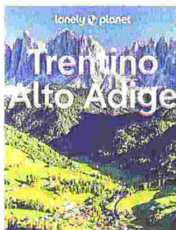
Trentino-Alto Adige/Denis Falconieri, Piero Pasini/Lonely . Italia/352 p./ 25 euro

sorprendere e di regalare grandi emozioni. Come consiglia Denis Falconieri, uno degli autori della guida, nell'introduzione al volume, «in Trentino-Alto Adige la bellezza si sviluppa in modo verticale».