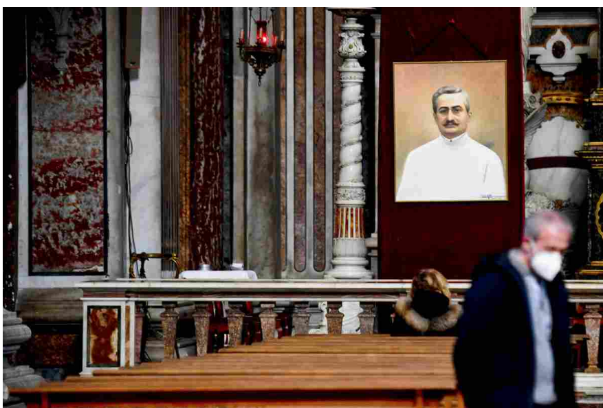
Il ritratto di san Giuseppe Moscati nella chiesa dell'Immacolata al Gesù Nuovo a Napoli

Valerio Pece - 26/11/2022 - 11:18 Cultura, Magazine