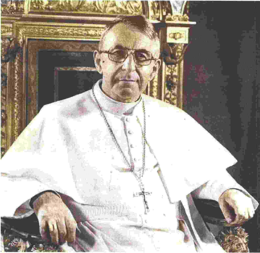
L'ANNIVERSARIO Giovanni Paolo I, al secolo Albino Luciani, venne eletto il 26 agosto del 1978

Ritaglio stampa ad uso esclusivo del destinatario, non riproducibile.