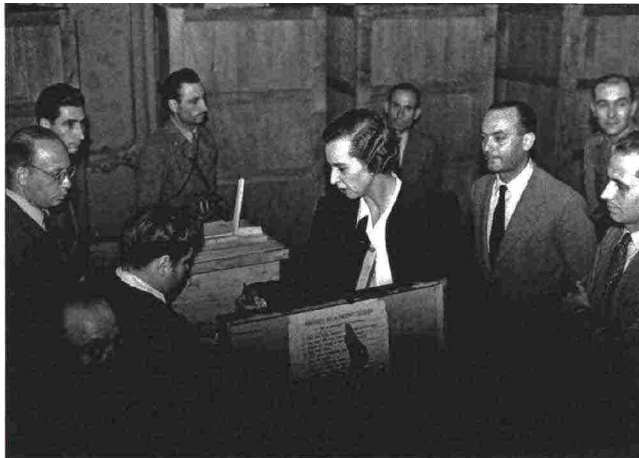
Maria José prende la scheda di voto al referendum per monarchia o repubblica, il 2 giugno 1946.

Di suo, Maria José si reca in Svizzera ad assistere al concerto di Toscanini, e riceve insulti da tutte e due le parti: dal Du-