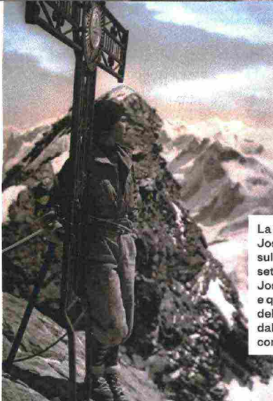
La principessa Maria José presso la croce sul monte Cervino, nel settembre 1941. Maria José era una sportiva e quando nel febbraio del 1945 tornò in Italia dalla Svizzera lo fece con gli sci ai piedi.