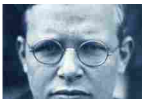
76 anni fa veniva ucciso Dietrich Bonhoeffer