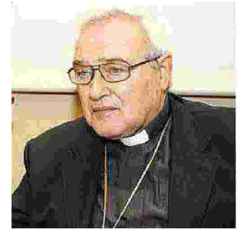
Monsignor Luigi Negri

re in faccia “contraddizioni e tradimenti” e alla “crisi di coscienza della propria identità”. Si è oscurata l'identità della chiesa, dice il vescovo, «è come se l'identità ecclesiale dipendesse da fattori che sono secondari quanto inefficaci, come un certo consenso della mentalità dominante, alla quale tanta ecclesiasticità corre dietro, o un certo benessere di carattere psi-