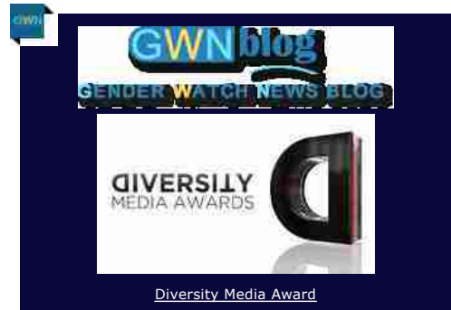
Diversity Media Award