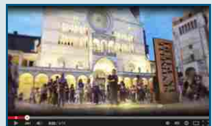
Sentinelle in Piedi: 100 piazze per la famiglia