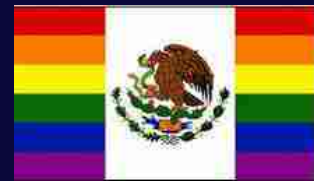
Messico: sì della Corte suprema alle "nozze" gay