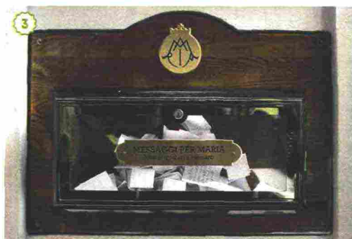
UNA DEVOZIONE SILENZIOSA. La fontana da cui sgorga l'acqua dotata secondo i fedeli di proprietà curative (1); la cappellina dedicata a Maria Rosa Mistica; la casella coi messaggi dei devoti. Madonna(3).

a Laus in Francia si è avuto solo nel 2008, più di tre secoli dopo le apparizioni, ma questo non ha impedito che si creasse un grande movimento di fede attorno a quel luogo». Del resto, anche il caso di Medjugorje, dove la Vergine si sarebbe palesata nel 1981, è ancora allo studio della Santa Sede, che non ne ha però potuto ignorare la grande portata popolare: 2 milioni di devoti visitano ogni anno la cittadina bosniaca. «Papa Francesco ha inviato lì un vescovo a esaminare la questione: a fine estate avremo il verdetto» conclude Grasso.