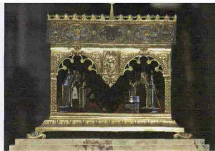
A sinistra, un ritratto del cardinale. A lato, il pulpito della chiesa universitaria S. Mary the Virgin, dove Newman predicava. Sopra, il reliquiario e, sotto, la tomba dove è stato sepolto il cardinale