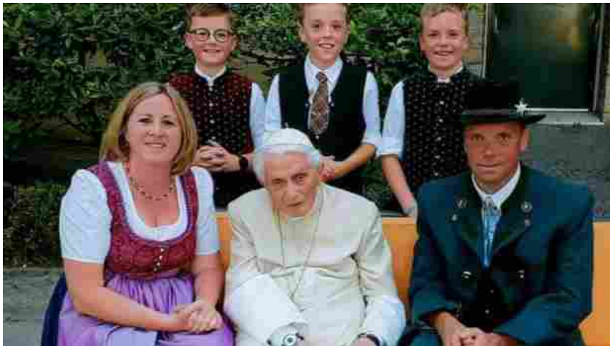
Fondazione Vaticana Joseph Ratzinger - Benedetto XVI