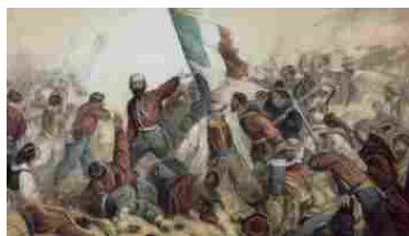
Un quadro iconico sul Risorgimento

Nonostante sia passato un secolo e mezzo dall'Unità d'Italia, il Risorgimento è ancora motivo di polemica, come si può vedere nelle librerie, dove troviamo volumi che riaccendono la faida tra nordisti contro meridionali, centralisti contro federalisti, cattolici contro anticlericali. Un'eccezione apprezzabile a questo inutile spiegamento di fazioni è