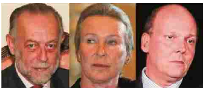
Da sinistra: Amedeo di Savoia, Maria Gabriella di Savoia e Sergio di Jugoslavia