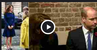
Kate Middleton, il vestito blu cobalto (e aderentissimo) è una meraviglia.