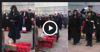
Meghan Markle, l'occasione è formidissima e lei... è super