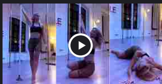
Diletta Leotta si lancia nella pole dance, ma è un vero disastro... Guarda