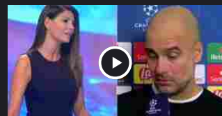
Ilaria D'Amico ci ricasca: la figuraccia in diretta tv con Pep Guardiola è