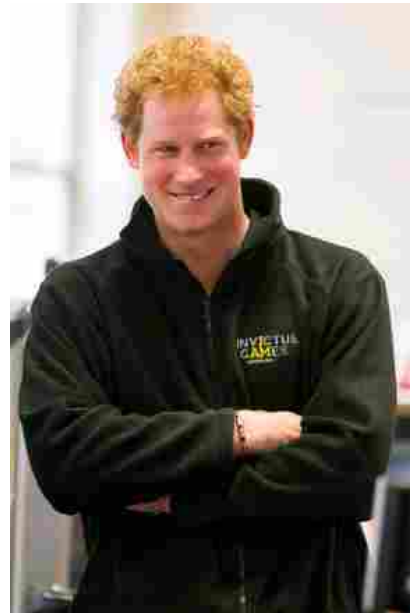
2. Harry d'Inghilterra