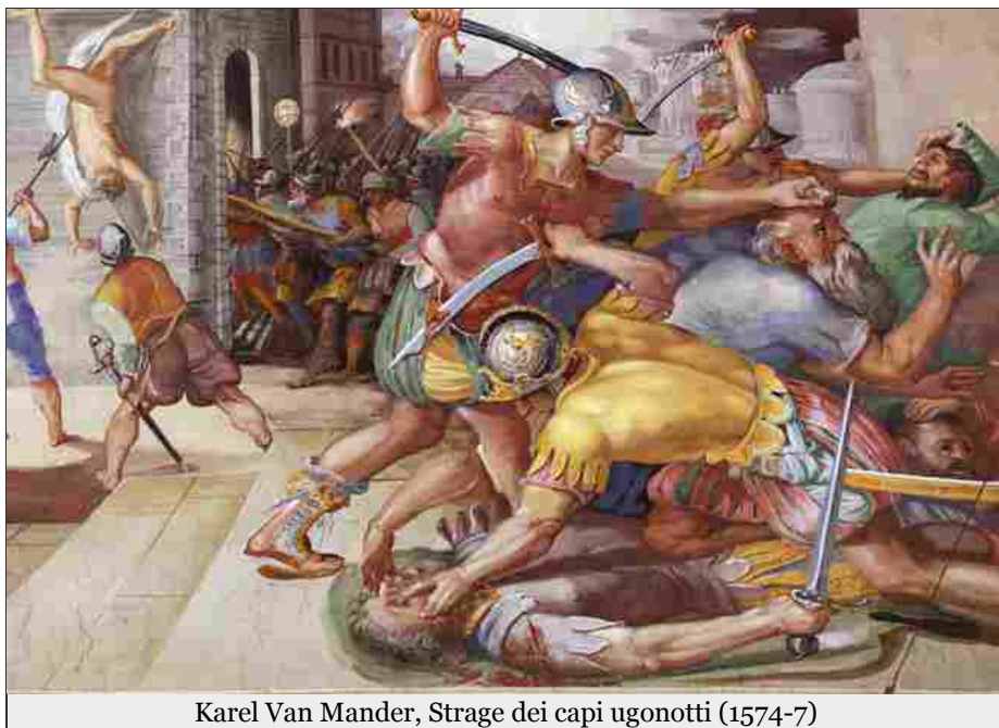
Karel Van Mander, Strage dei capi ugonotti (1574-7)